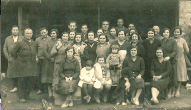
Façana de la fàbrica . Postal Raymond. Treballadors i treballadores de la “fàbrica de les agulles”. 1935.

La metal·lúrgica Folch, instal·lada a la vila el 1924 per Pere Folch continua viva i actualitzada amb la seva singular activitat productiva. Aquesta fàbrica és un espai de referència laboral per a moltes dones de la vila que durant diverses generacions hi han treballat ja sigui a la nau industrial o de forma deslocalitzada.